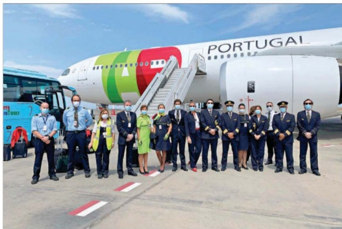
MEMÓRIA. UMA FOTO INUSITADA, MAS QUE FICARÁ COMO RECORDAÇÃO DE TEMPOS DE PESADELO: A TRIPULAÇÃO DA TAP POSA EM FRENTE A UM AVIÃO DA TRANSPORTADORA AÉREA. A MÁSCARA IMPÕE-SE.